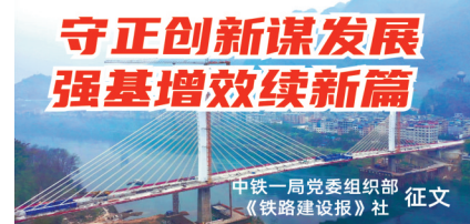
中铁一局党委组织部 征文

当集团公司春节假期结束后，他立即下发调度通知，要求加快做好节后生产组织，积极开展筹备开(复)工的各项施工准备。